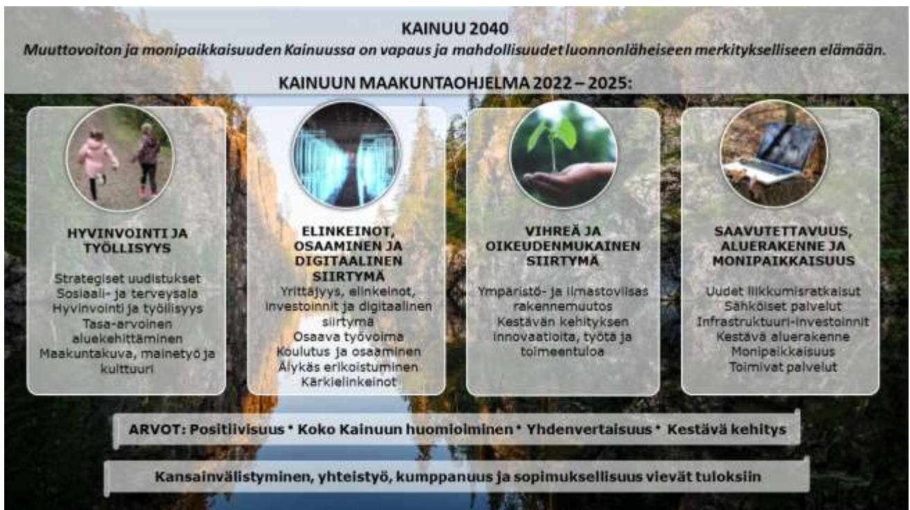
Kuva 2. Kainuun maakuntaohjelman 2022–2025 rakenne.

Kainuu-ohjelma sisältää maakuntasuunnitelman ja vision 2040, sekä arvot. Kainuu 2040 visio tiivistää Kainuu-ohjelman keskeiset tavoitteet: runsas muuttovoitto, kestävä väestön kehitys, osaavan työvoiman riittävyys, kasvava monipaikkainen asuminen ja vierailut Kainuussa, ilmasto- ja ympäristövastuullisuuden sekä Kainuussa olevien ja sinne tulevien yhteisöllisyyden ja merkityksellisyyden vahvistuminen. Visioon pyritään maakuntasuunnitelman pitkän ajan kehittämistavoitteilla sekä maakuntaohjelman vuosien 2022–2025 tavoitteilla ja toimenpiteillä. Kuvaan 2 on tiivistetty Kainuun maakuntaohjelman 2022–2025 rakenne.