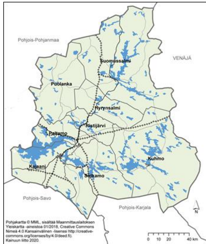
Kuva 2. Kainuun tuulivoimamaakuntakaavan kaava-alue.