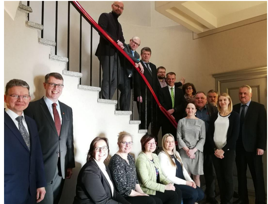
Euregio Karelian hallitus 15.2.2019 Joensuu