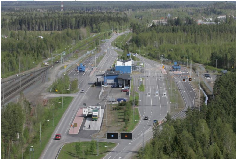
Niiralan kansainvälinen ryp: