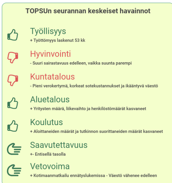
Kuva 1. TOPSUn seurannan ja Kainuun tilannekuvan keskeiset havainnot ajalla 2018-2019.

TOPSUn seurannan ja Kainuun tilannekuvan keskeiset havainnot on esitetty kuvassa 1. Mittareiden (taulukko 3.) valossa aluetalouden, työllisyyden ja koulutuksen tilanteet ovat kehittyneet myönteisesti, mutta kuntataloudessa ja hyvinvoinnissa on yhä kasvavia haasteita. Saavutettavuus ja Kainuun vetovoima ovat entisellä tasollaan. TOPSUn seurannan toimintalinjojen keskeiset havainnot on esitelty seuraavassa tekstissä.