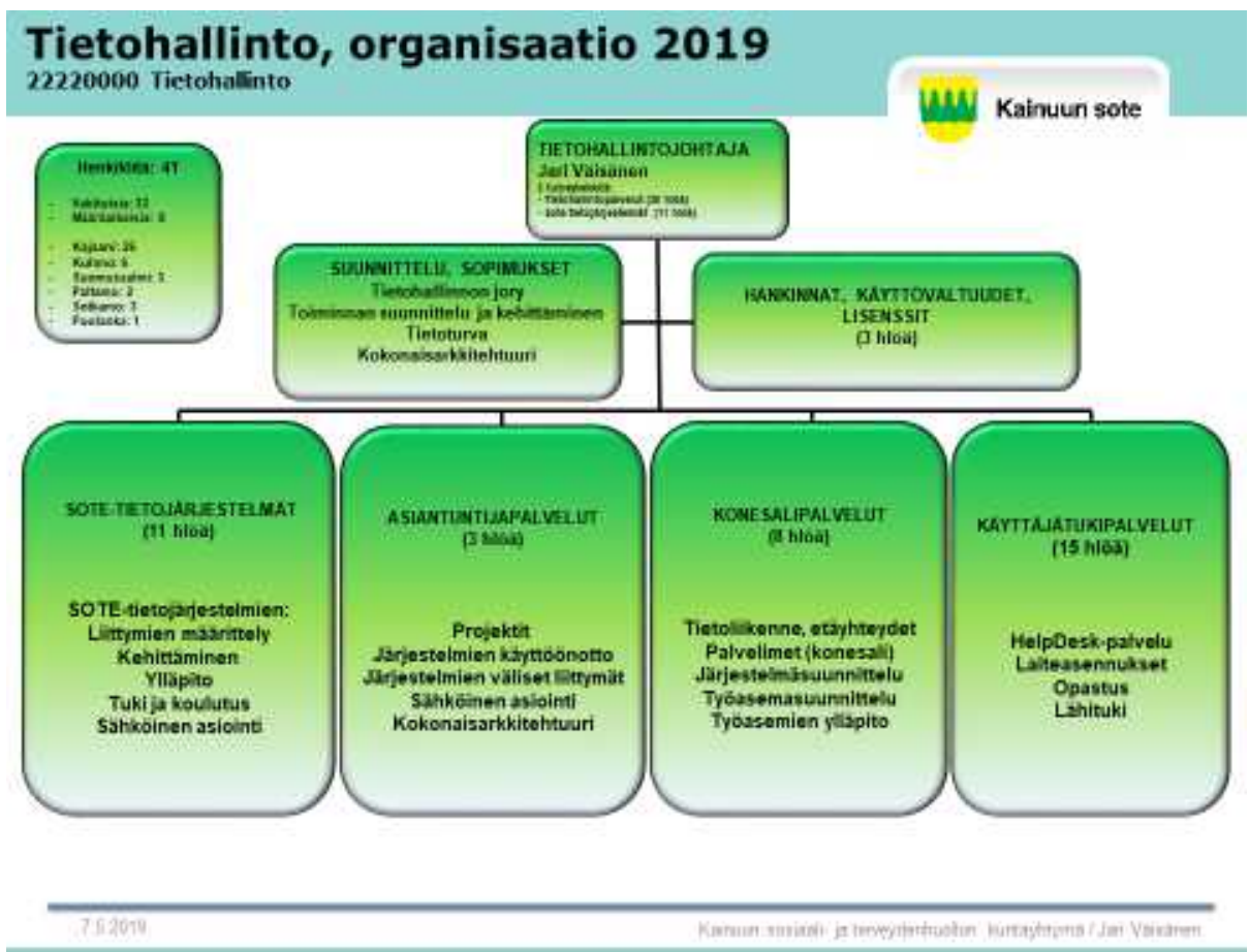
Kuva 2. Kainuun soten tietohallinnon organisaatio 2019

Tällä hetkellä Kainuun soten tietohallinnossa työskentelee 40 henkilöä seuraavasti: