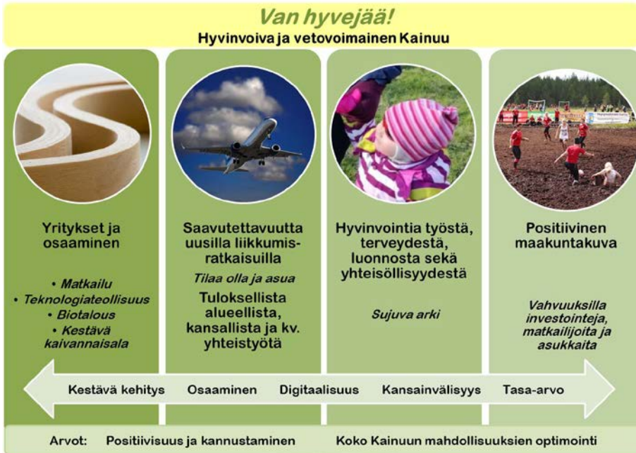
Kuva 1. Kainuun maakuntaohjelman (v. 2018 - 2021) kehittämisen painopisteet.

Sanoja palluroihin: Puhdasta vettä, Puhdasta ilmaa, Puhdasta ruokaa, Turvallista elämää, Hiljaisuutta, Rauhallisuutta, Erämaata, Erätaitoja, Riistaa, Kaloja, Sieniä, Metsämarjoja, Maanläheisyyttä, Luontokuvausta, Kesämökkejä, Puurakentamista, Bioenergiaa. Kajaanin Runoviikko, Kuhmon kamarimusiikki, Hyrynsalmen Suopotkupallo