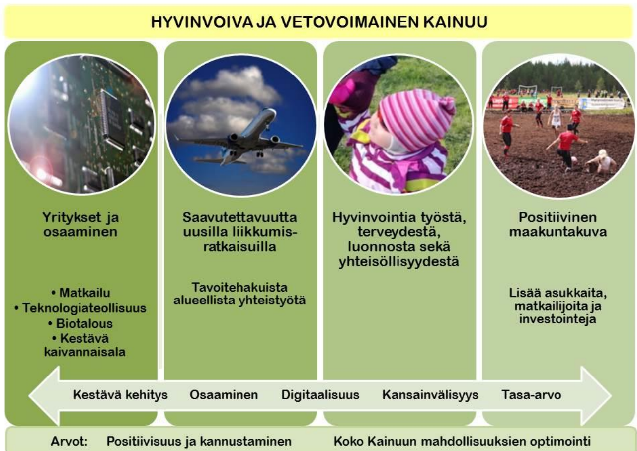
Kuva 2. Kainuun maakuntaohjelman 2018–2021 kehittämisen painopisteet ja Kainuu-ohjelman visio