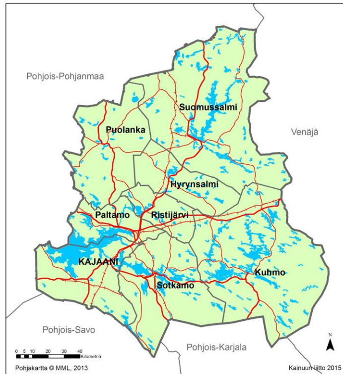
Kuva 2. Kainuun maakuntakaavan kaava-alue.

Enklaaveja (=hallinnollinen alue tai sen osa, joka on kokonaan tai suurimmaksi osaksi toisen vastaavan hallinnollisen alueen ympäröimä) ei käsitellä maakuntakaavassa maakuntakaavan yleispiirteisestä mittakaavasta (1:250 000) johtuen.