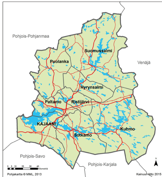
Kuva 2. Kainuun maakuntakaavan kaava-alue.

Enklaaveja (=hallinnollinen alue tai sen osa, joka on kokonaan tai suurimmaksi osaksi toisen vastaavan hallinnollisen alueen ympäröimä) ei käsitellä maakuntakaavassa maakuntakaavan yleispiirteisestä mittakaavasta (1:250 000) johtuen.