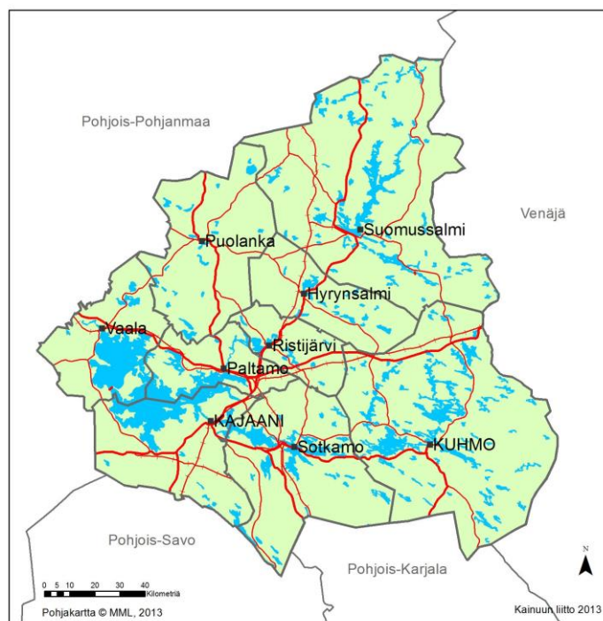
Kuva 2. Kainuun tuulivoimamaakuntakaavan kaava-alue.

Kainuun tuulivoimamaakuntakaava koskee kaikkia Kainuun yhdeksää kuntaa: Hyrynsalmi, Kajaani, Kuhmo, Paltamo, Puolanka, Ristijärvi, Sotkamo, Suomussalmi ja Vaala. Kaava-alue on esitetty kuvassa 2.