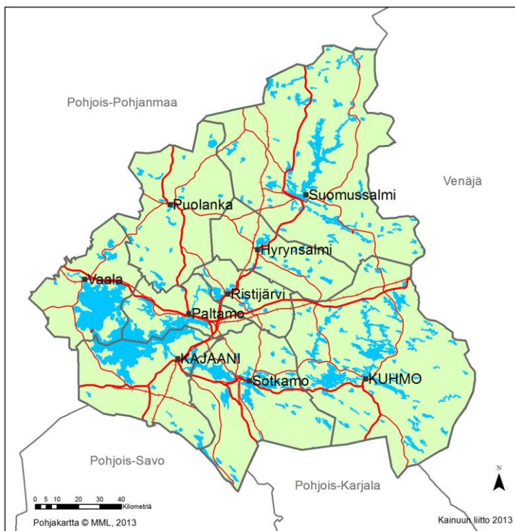
Kuva 3. Kainuun kaupan vaihemaakuntakaavan kaava-alue.